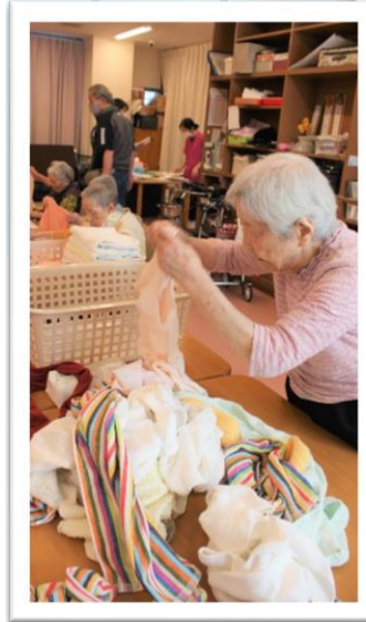
きれいに手際よく畳んでいきます